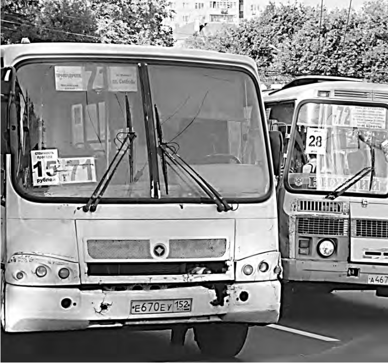
Владельцы маршрутных такси вправе сами устанавливать тарифы.

— Новое тарифное меню, побуждающее к переходу на безналичную форму оплаты проезда, — это практика всех современных мегаполисов и экономического стимулирования МОТ, — говорит он. — Так МОТ сможет приобрести конкурентные преимущества перед частным. Мы хотим получить