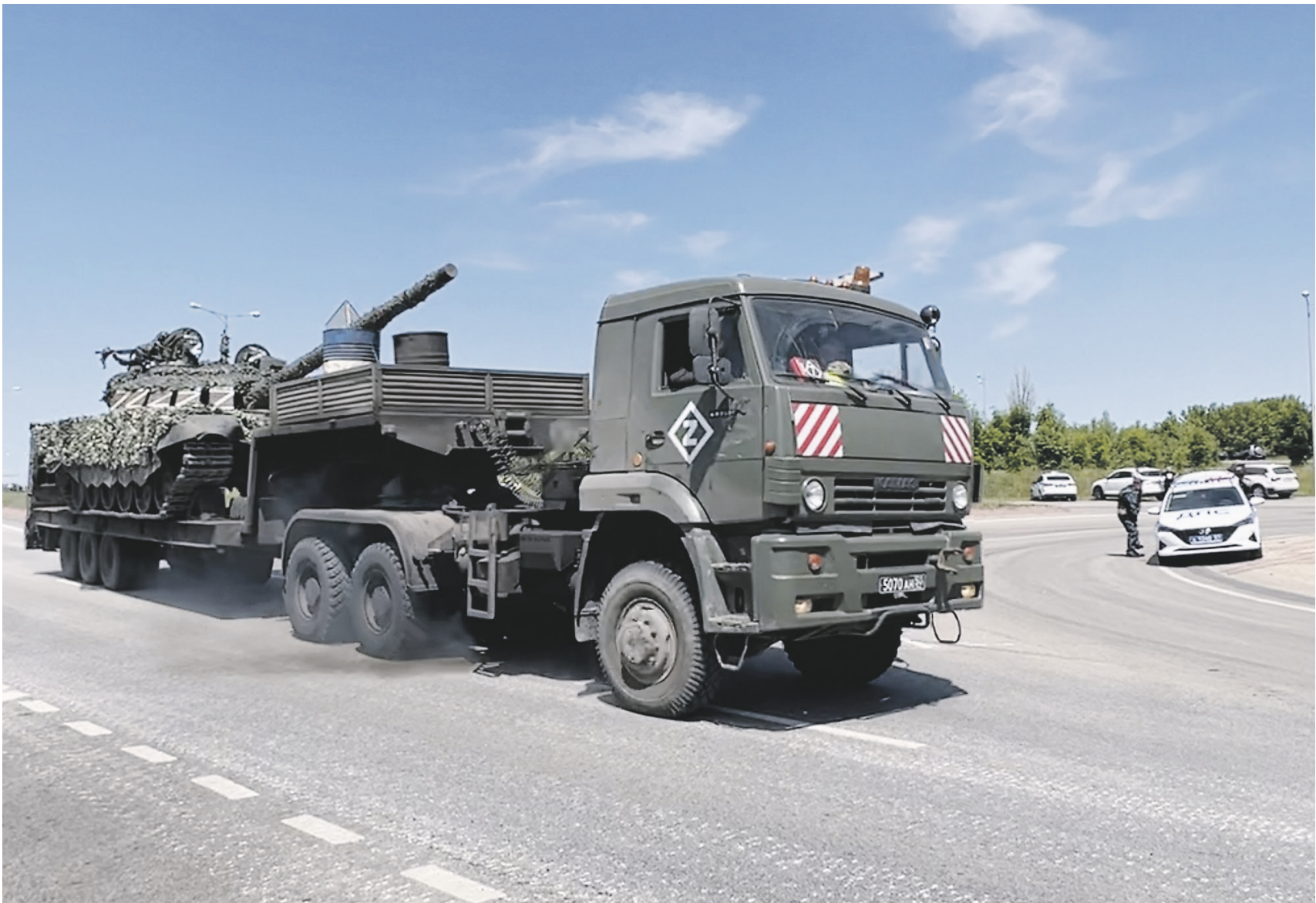
Для усиления обороны границы в район города Шебекино перебрасывают военную технику