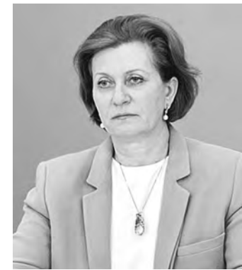
Анна Попова, руководитель Роспотребнадзора:

—Чтобы снизить риск распространения коронавируса, нужно, чтобы люди носили маски, была социальная дистанция и те праздники, которые нам предстоят, мы провели в кругу семьи, лучше на свежем воздухе. Необходимо отменить все запланированные массовые мероприятия. Выполнение этих рекомендаций позволит снизить заболеваемость коронавирусной инфекцией через 10—14 дней. Ситуация с коронавирусом находится в достаточно хрупком равновесии. Главное сегодня—не почувствовать ветер свободы, его на самом деле нет.