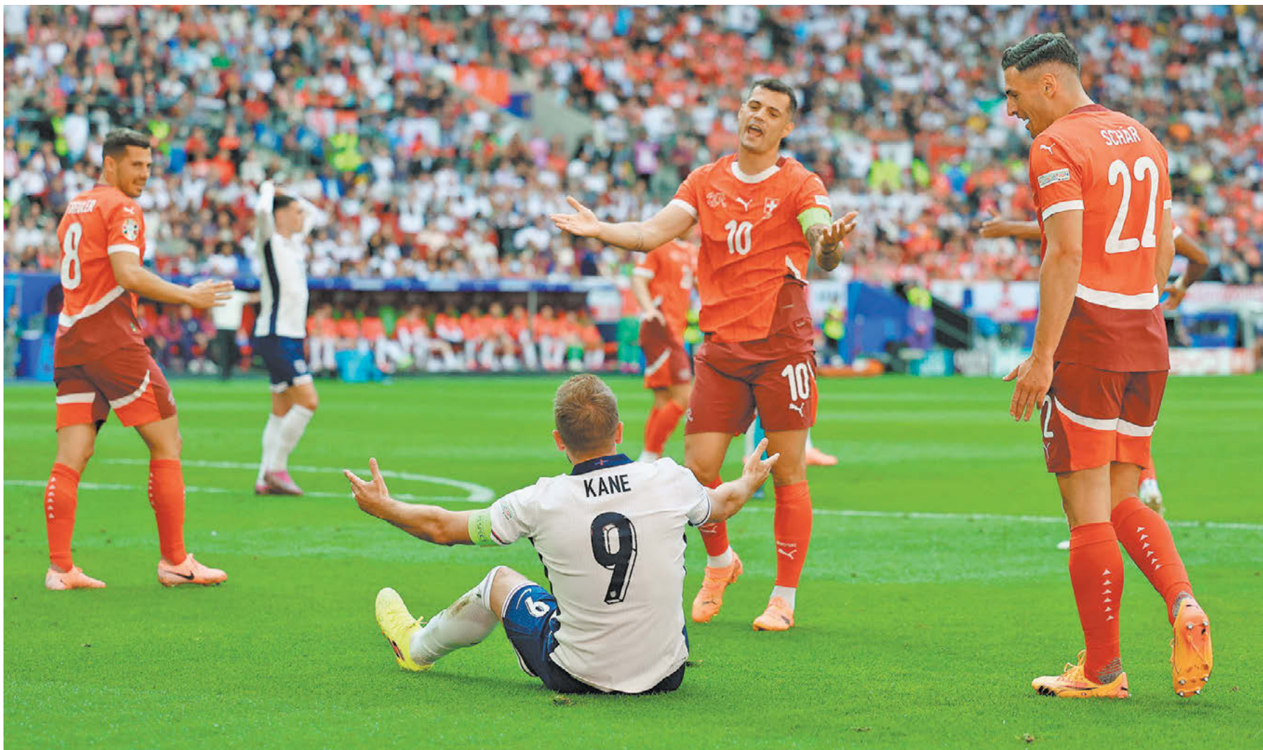
Суббота. Дюссельдорф. Англия – Швейцария – 1:1 (пен. – 5:3). Лидер англичан Харри Кейн в окружении швейцарцев

Чемпионат Европы пока совершенно не оправдывает ожиданий: минимум сенсаций, закрытый, осторожный футбол. Не стали исключением и четвертьфинальные матчи, где только Испания и Германия выдали зрелищный спектакль