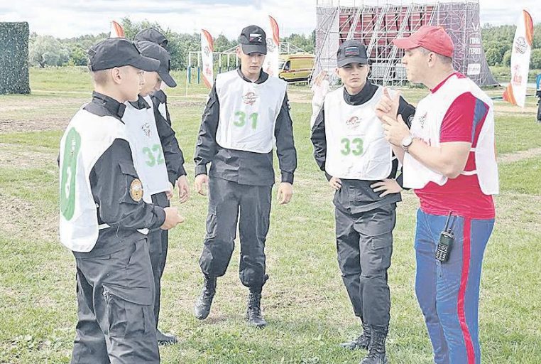
Москвичи перед очередным испытанием.

участников СНГ. Игра направлена на укрепление контактов между молодёжными военно-патриотическими организациями стран Содружества. Её организатором выступило Министерство обороны РФ.