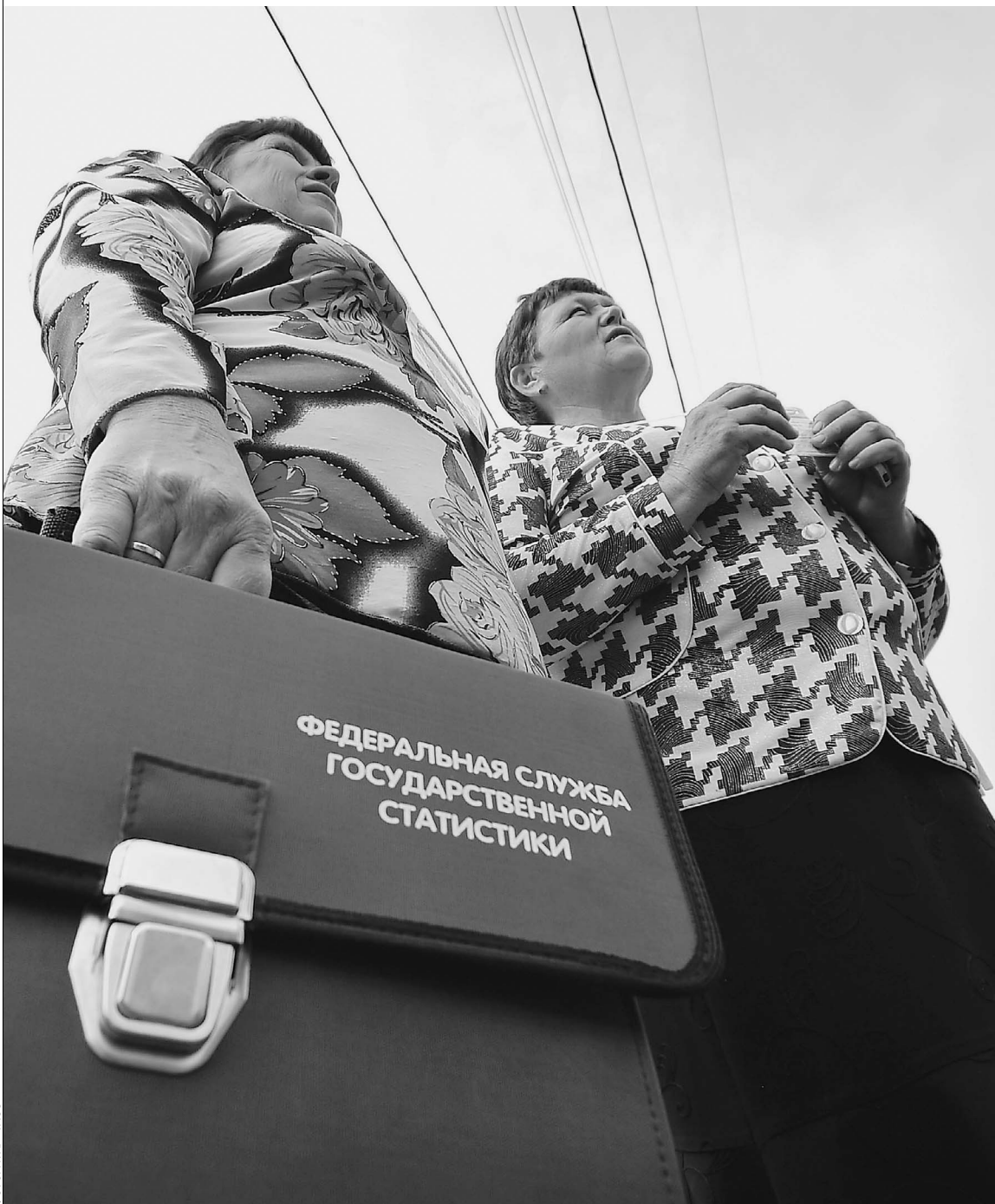
Переписчики скоро появятся на каждом пороге. Портфель с эмблемой — их знак отличия

Глава Росстата Александр Суринов рассказал «Известиям», как пройдет начинающаяся сегодня перепись