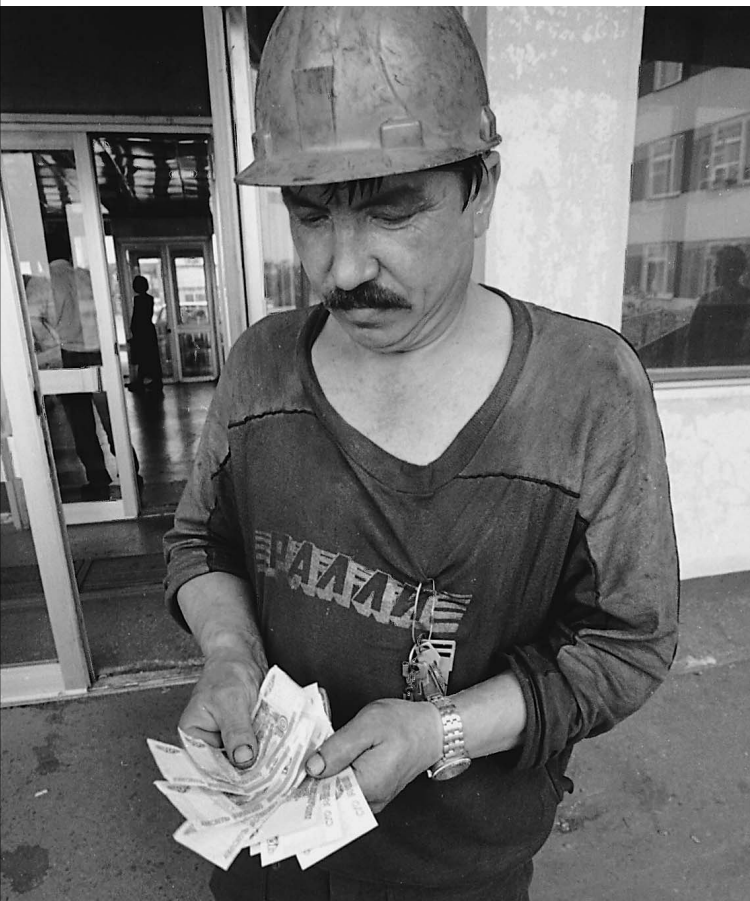
Добыча угля хоть и опасное, но выгодное дело. Работники отрасли — вторые среди тех в стране, кто особенно хорошо зарабатывает