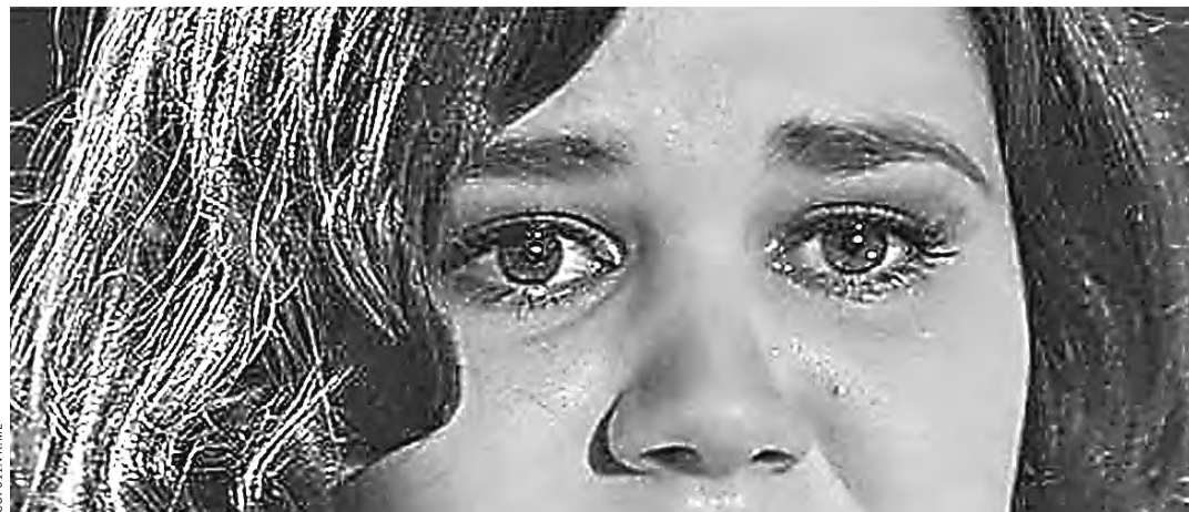
Дина Гарипова: Мне всегда нравилось исполнять музыку разных направлений.

Победительница первого «Голоса» Дина Гарипова наконец выходит на большую сцену. 30 октября она совершит «Два шага до любви»