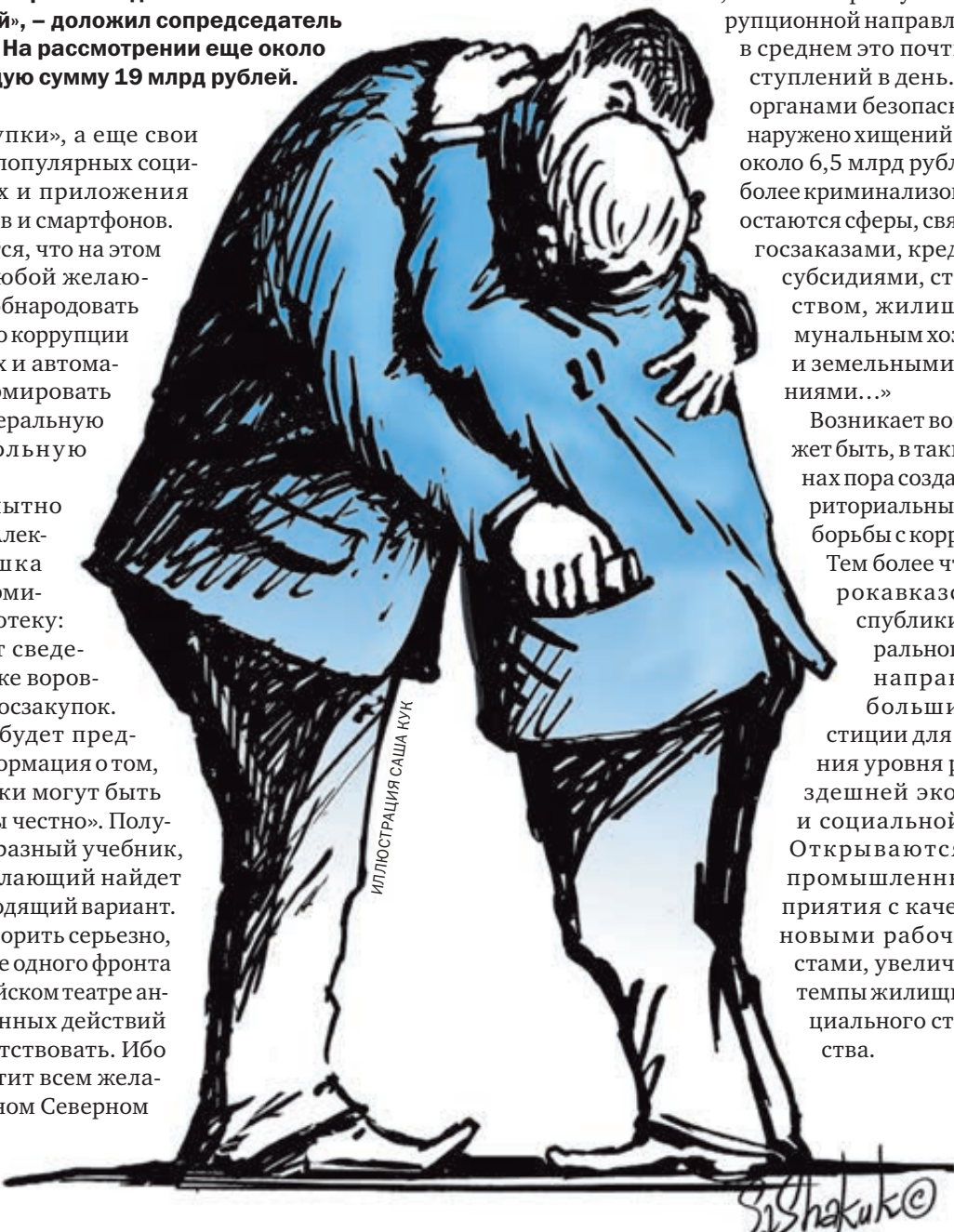
Иллюстрация Саша Кук

Но если говорить серьезно, появление еще одного фронта на общероссийском театре антикоррупционных действий можно приветствовать. Ибо дел здесь хватит всем желающим. На одном Северном Кавказе, как за а в и л президент Владимир