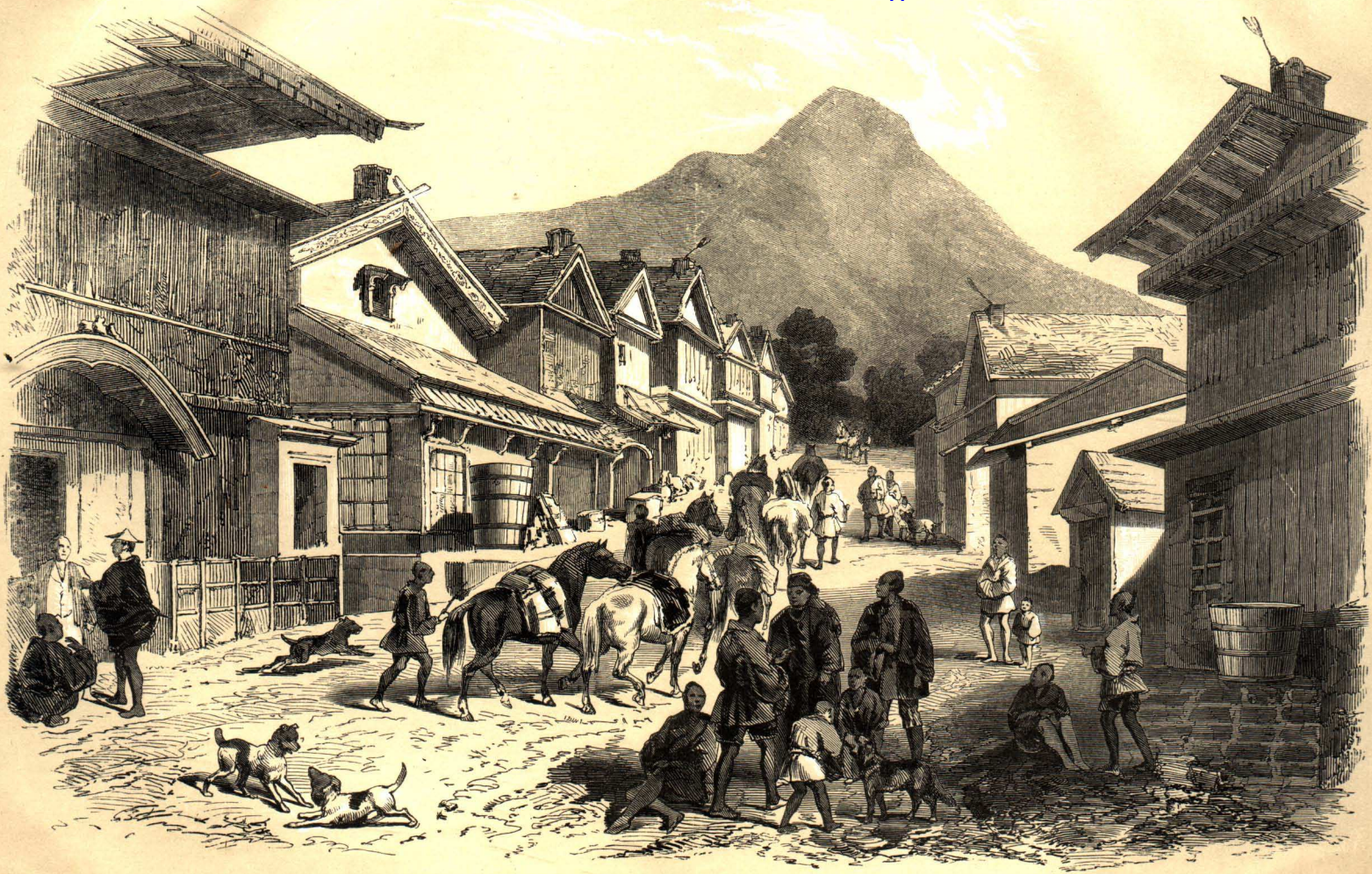
Straße in Hakotade.