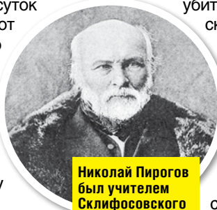
Николай Пирогов был учителем Склифосовского