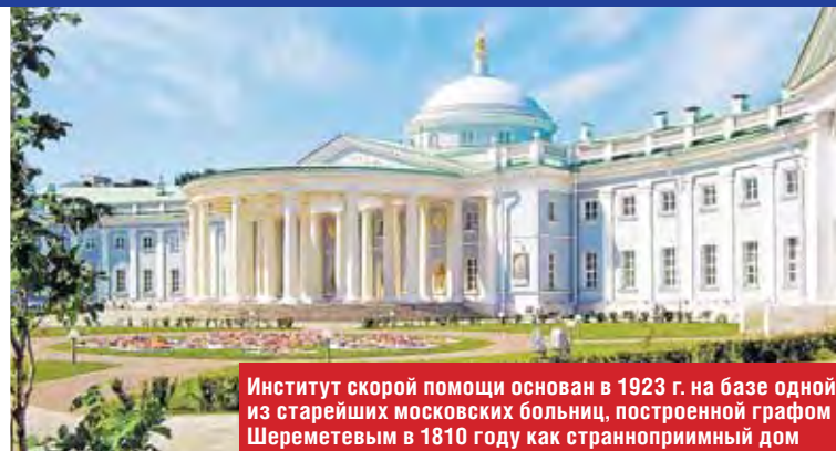
Институт скорой помощи основан в 1923 г. на базе одной из старейших московских больниц, построенной графом Шереметевым в 1810 году как странноприимный дом

800 врачей Склифа спасают ежегодно десятки тысяч россиян, проводя уникальные операции по пересадке органов