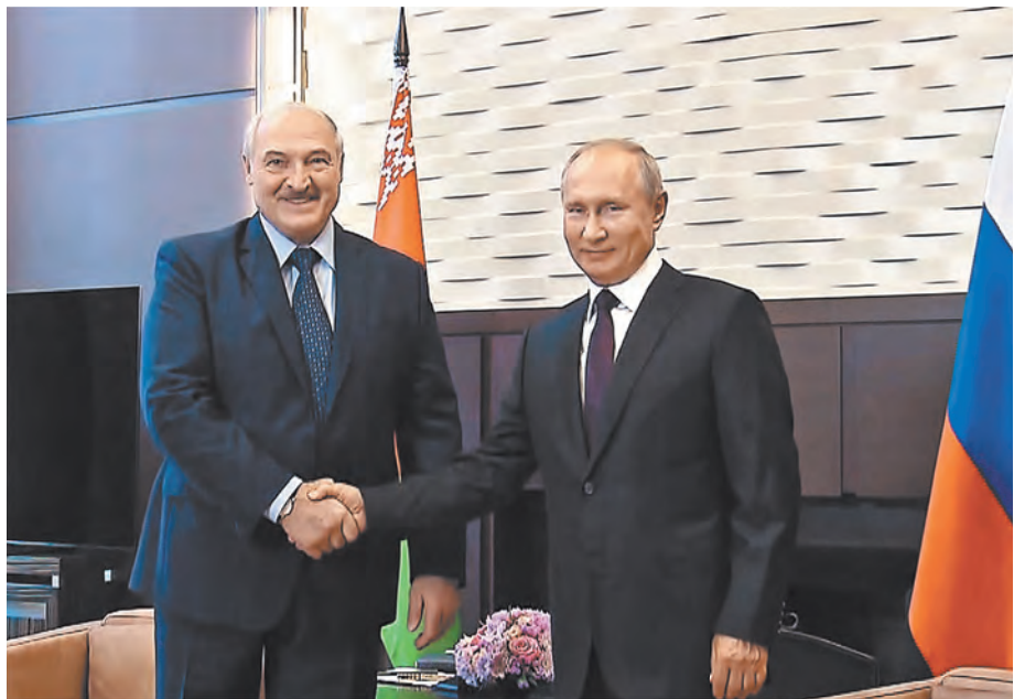
В повестке дня переговоров президентов России и Беларуси — ключевые вопросы двусторонних отношений.

Предложение Александра Лукашенко начать работу по Конституции Владимира Путина назвал логичным, своевременным, целесообразным.