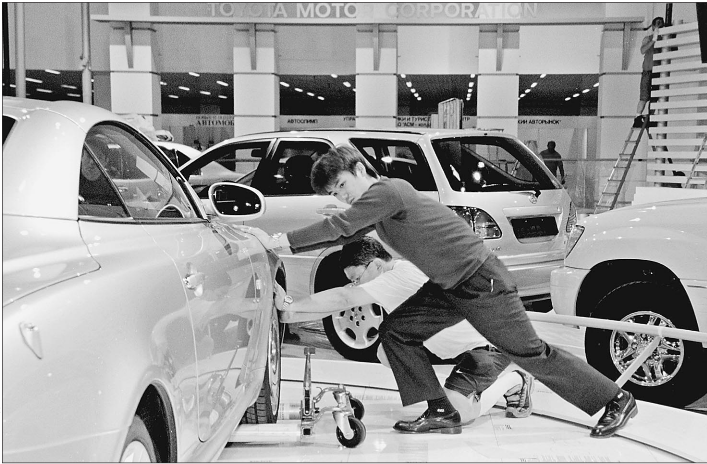
«Тойота», «Тойота» — уйди от Федота

В министерстве осторожно сказали, что не уполномочены комментировать слова находящегося в отъезде главы. Источник в министерстве поначалу даже сомневался, в их ли стенах вырезает опасный плод и не готовят ли постановление в каком-либо департаменте министерства. Он даже сослался на то, что совсем недавно премьер сам правил проект