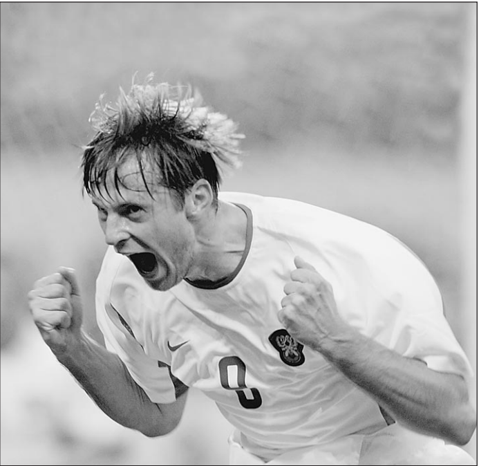
Рождение новой футбольной сборной состоялось