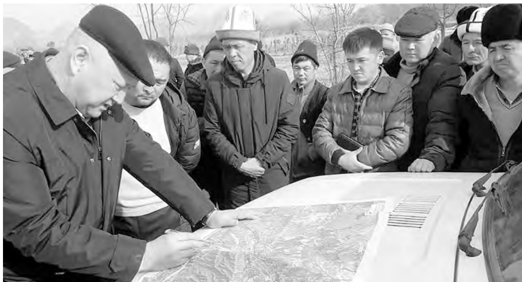
ПРЕСС-СЛУЖБА ПРАВИТЕЛЬСТВА КР