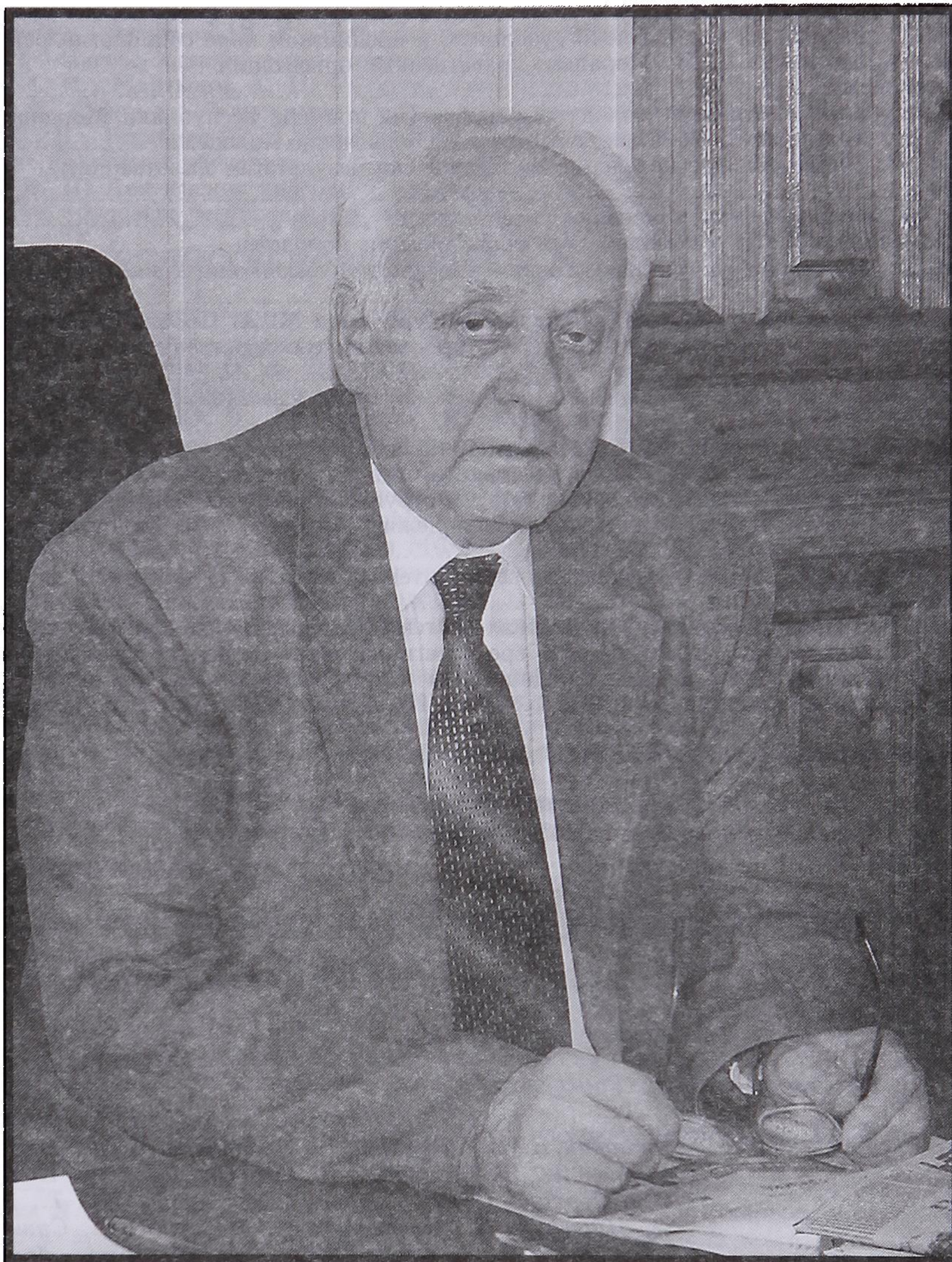
АЛЕКСАНДР ИВАНОВИЧ СУХАРЕВ (1931—2010)