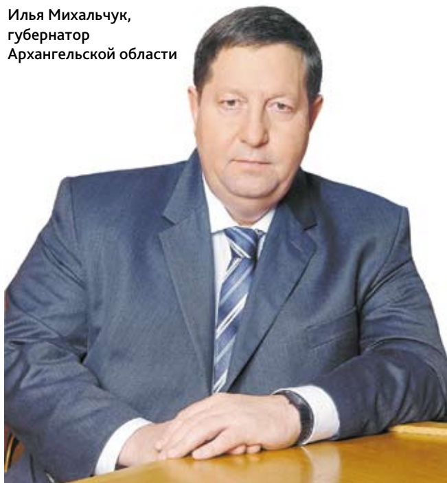
Илья Михальчук, губернатор Архангельской области