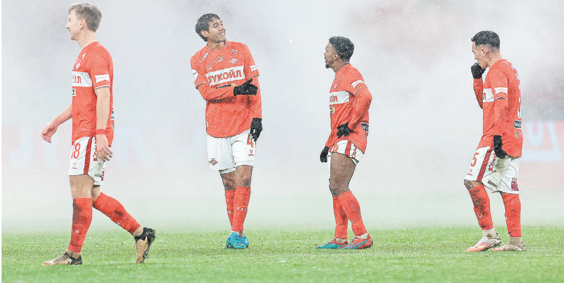
Суббота. Москва. Тушино. «Спартак» – «Пари НН» – 0:3. Красно-белые врываются в чемпионскую гонку