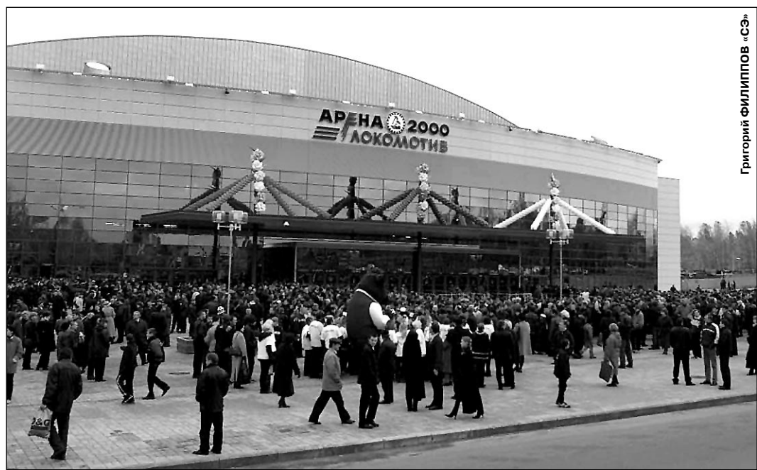
Вчера. Ярославль идет на хоккей - в новую «Арену-2000».

Бомбардиры: ЕПАНЧИН-ЦЕР (Северсталь) - 15 очков (10+5), ШАЛАМАЙ (Салават Юлаев) - 15 (3+12), А. КОРЕШКОВ (Металлург Мг) - 13 (7+6), Е. КОРЕШКОВ (Металлург Мг) - 13 (6+7), ТОРГАЕВ (Северсталь) - 13 (5+8), СУШНСКИЙ (Авангард) - 13 (3+10), КЛИМЕНТЬЕВ (Металлург Мг) - 13 (3+10). Сегодня Авангард - Спартак Завтра в 14-м туре встречаются: Металлург Мг - Северсталь, Мечел - СКА, Локомотив - Салават Юлаев, Торпедо - Лада, Металлург Нк - Ак Барс, Крылья Советов - Нефтехимик, Амур - Молот-Прикамье, ЦСКА - Динамо.