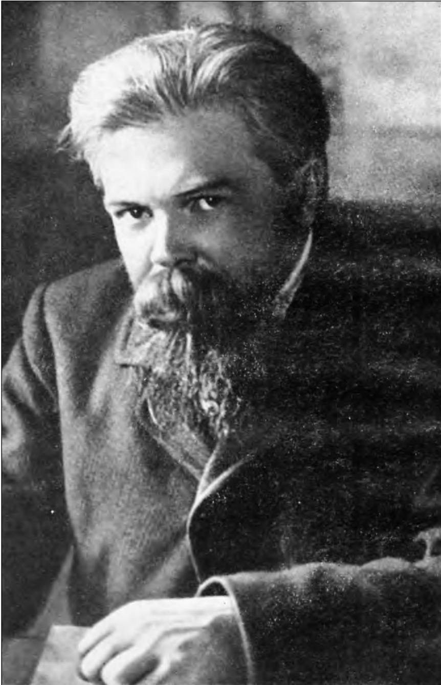
Николай Александрович Рубакин (1862—1946)