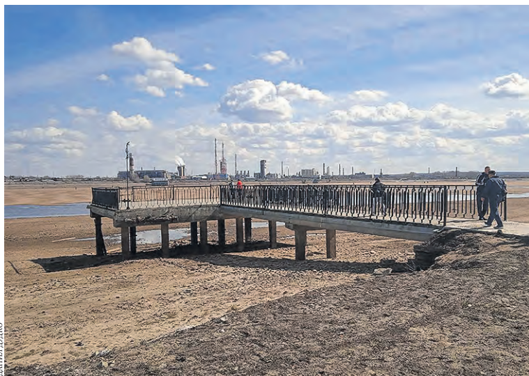
Обычно Строгановские палаты в Усолье весной полностью заливает водой. В этом году Кама ушла от берега на десятки метров.

Низкий уровень воды в реках вызывает тревогу не случайно. Ведь возрастает опасность возгорания торфяных болот, например, под Краснокамском. Правда, в МЧС заверили, что готовы к такому развитию событий. Возможно, появятся проблемы на водозаборах, питающих населенные пункты и предприятия. Но, как считают специалисты, Пермский край благодаря огромной Каме пока обеспечен водой.