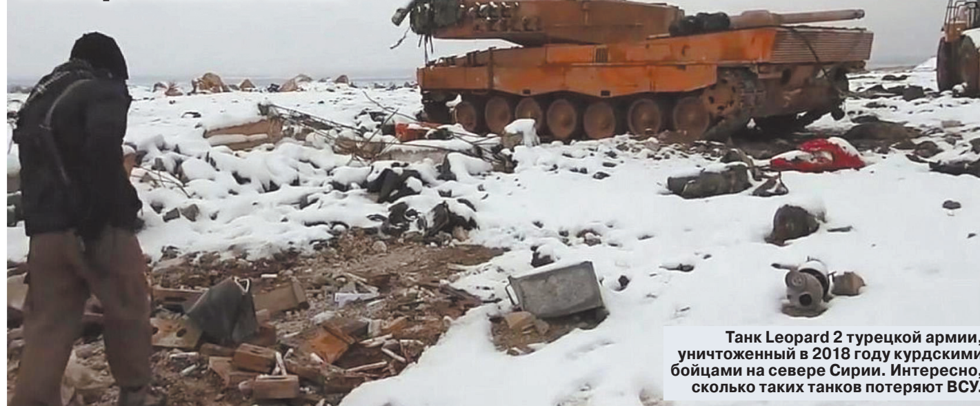
Танк Leopard 2 турецкой армии, уничтоженный в 2018 году курдскими бойцами на севере Сирии. Интересно, сколько таких танков потеряют ВСУ.

Экс-главком Сухопутных войск рассказал, как надо уничтожать немецкие и американские танки