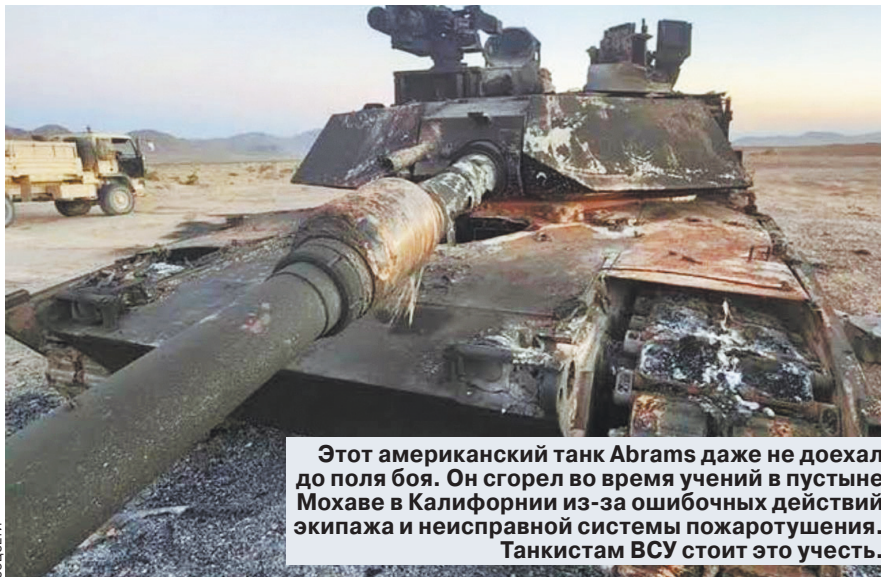
Этот американский танк Abrams даже не доехал до поля боя. Он сгорел во время учений в пустыне Мохаве в Калифорнии из-за ошибочных действий экипажа и неисправной системы пожаротушения. Танкистам ВСУ стоит это учесть.

Читайте 2-ю стр. Ежедневная общественно-политическая газета Распространяется в 89 субъектах РФ Цена в розницу договорная