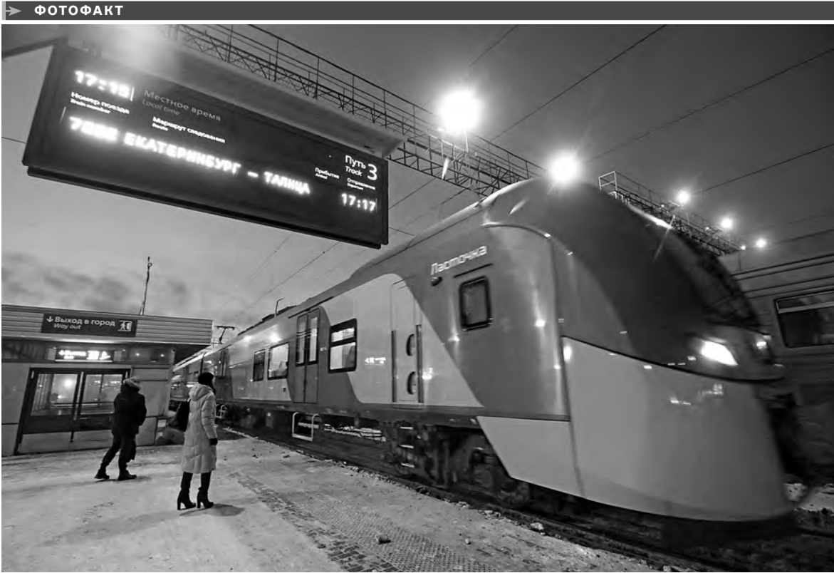
Скоростной электропоезд «Ласточка» соединил Екатеринбург и Талицу. Прежде «Ласточки» ездили до Нижнего Тагила, Каменска-Уральского и Кузино. Чтобы добраться из среднеуральской столицы до отдаленной Талицы, пассажирам приходилось совершать пересадку на станции Ощепково. С запуском «Ласточки» на тюменском направлении время в пути сократится почти на час.