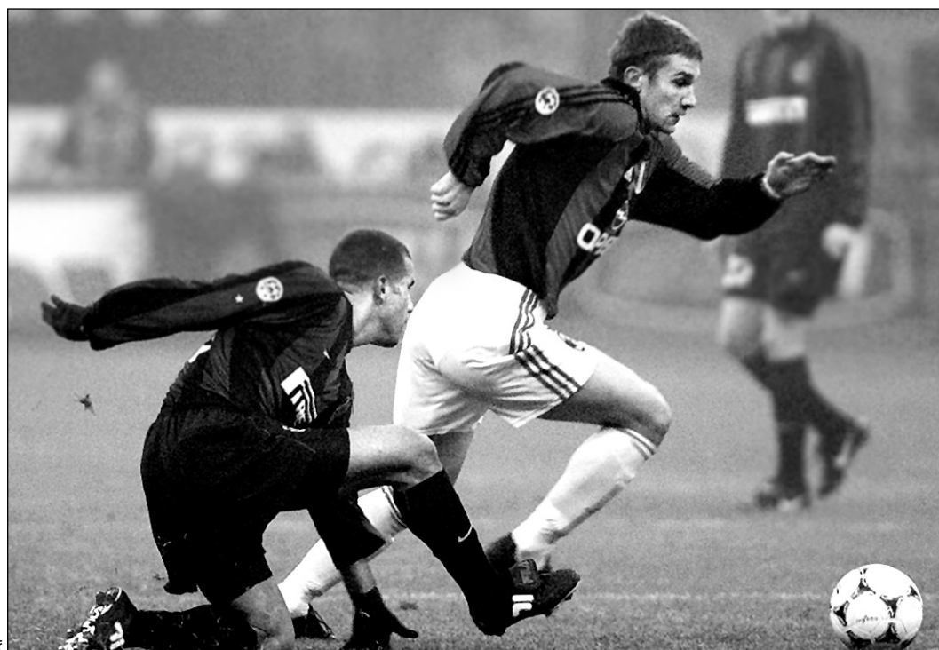
Андрей ШЕВЧЕНКО (справа) блестяще вписался в состав «Милана», забив в первом круге итальянского чемпионата 11 голов.

- У меня нет сомнений, что это нападающий высокого класса. Многие называют его моим преемником в «Милане», но думаю, что Шевченко хочет остаться самим собой, и пока это ему неплохо удается.