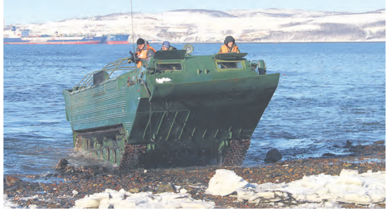
ПТС-2 сочетает манёвренность и уникальную систему передвижения.

Для поддержания и совершенствования необходимых навыков у специалистов разного инженерного профиля на вооружении ОМИП СФ, помимо прочего, находится несколько учебных классов с динамическими тренажёрами. Их главное преимущество перед обучением на реальной технике - возможность выполнения задач инженерного обеспечения без расхода моторесурса и ГСМ.