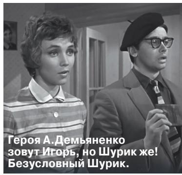
Героя А. Демьяненко зовут Игорь, но Шурик же! Безусловный Шурик.

Семейная комедия «Взрослые дети» напомнила о временах, когда СССР был оплотом глобализма