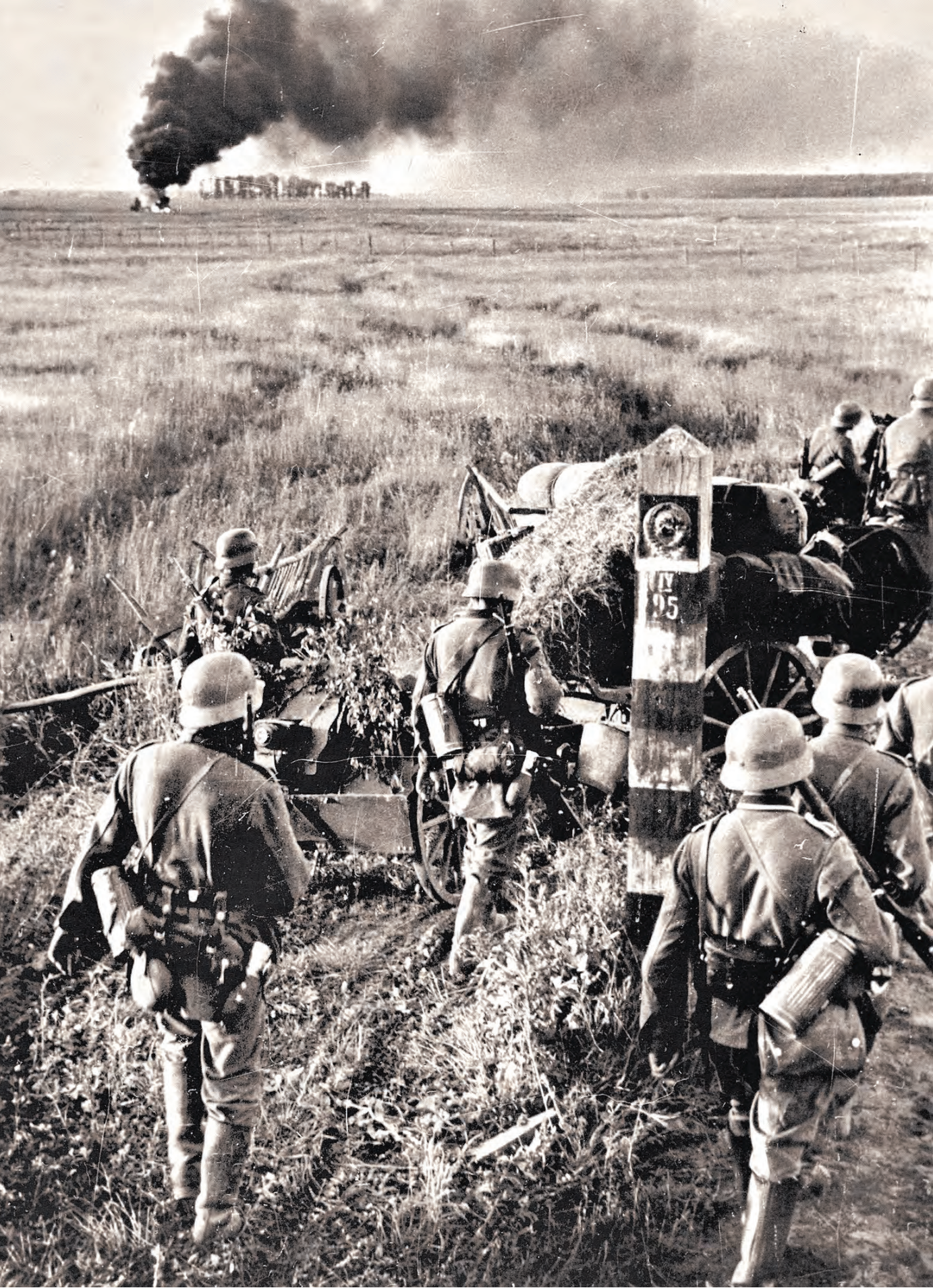
22 июня 1941 года. Немецкие войска переходят государственную границу СССР.

ОТЦЫ Кто пошел воевать 22 июня 1941 года