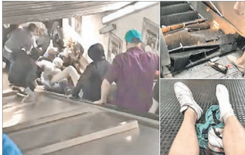
Трагедия в римском метро, где пострадали болельщики.