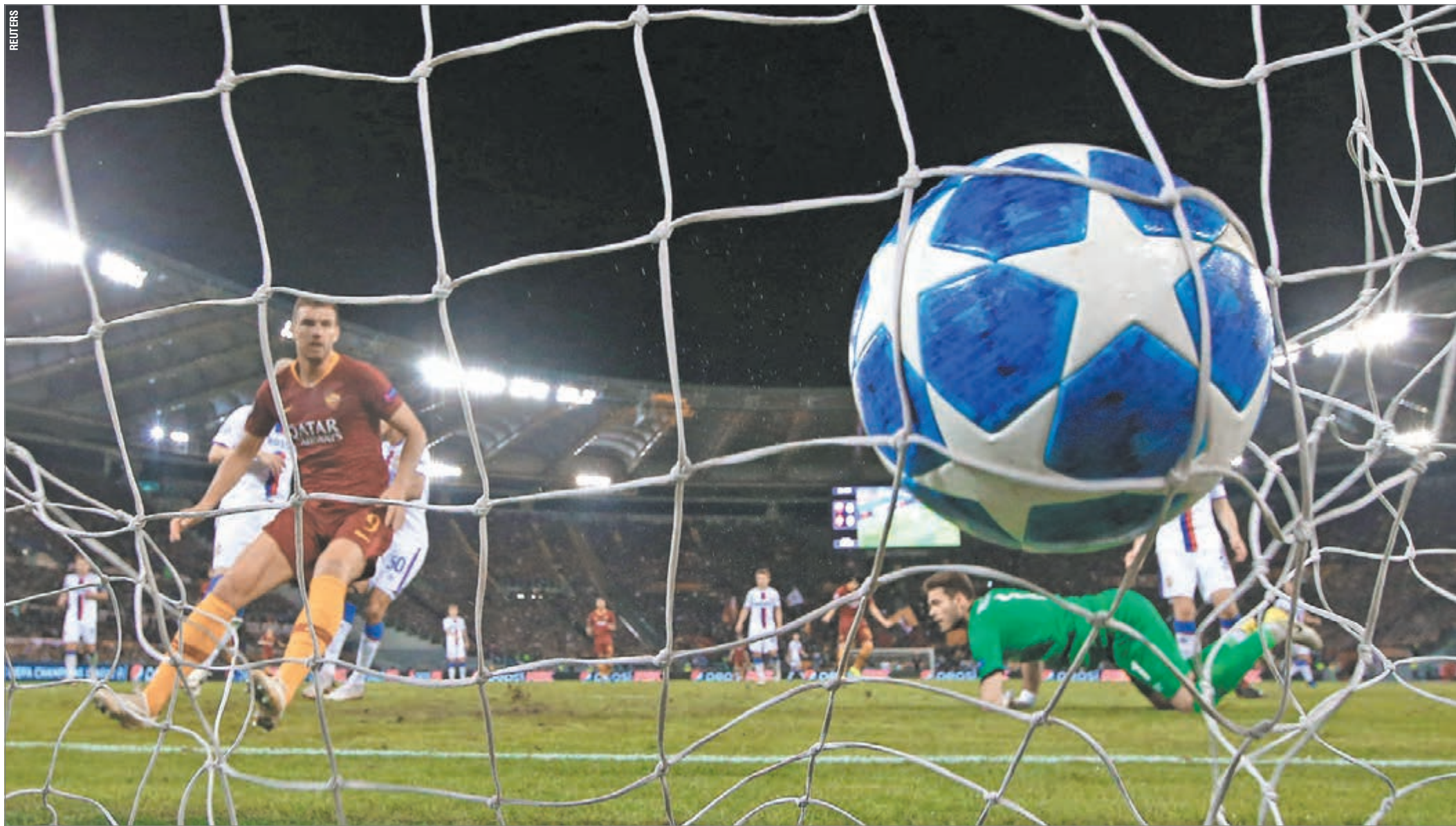
Вчера. Рим. «Ромы» - ЦСКА - 3:0. 30-я минута. Эдин ДЖЕКО (слева) открывает счет.

Вчера ЦСКА потерпел безоговорочное поражение от «Ромы» (0:3). Но это не самое печальное. Перед матчем случилась трагедия в римском метро, где из-за неполадок в системе эскалатора серьезно пострадали армейские болельщики. Это все напоминает встречу этих же команд осенью 2014-го, которую красно-синие тоже проиграли (1:5) на фоне жестоких разборок фанатов.