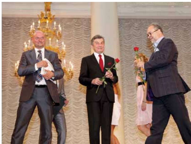
Высокие гости были счастливы оказаться на празднике не меньше первокурсников.