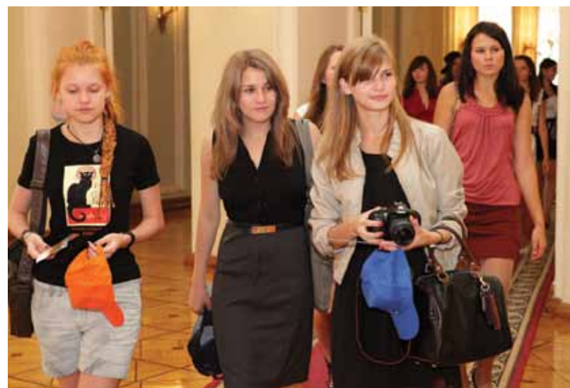
В Колонный зал первокурсники входили явно робя.

Накануне 1-го сентября поздравить первокурсников и своих преподавателей пришли и выпускники МГУ Печати. Многим из них хотелось сказать спасибо