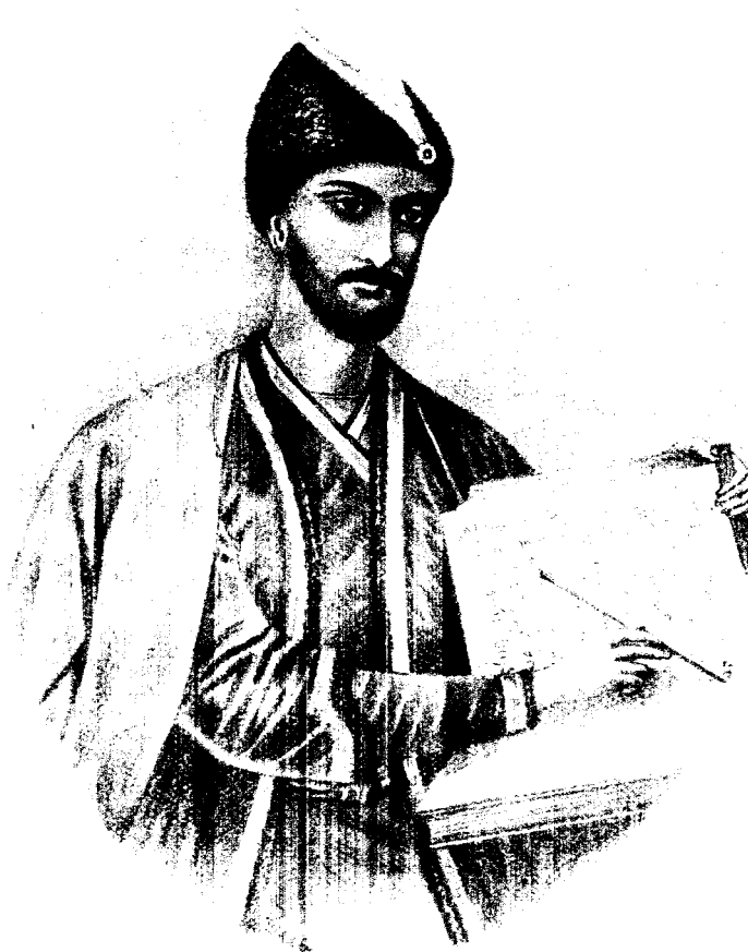
ШОТА РУСТАВЕЛИ ГРУЗИНСКИЙ НАРОДНЫЙ ПОЭТЪ