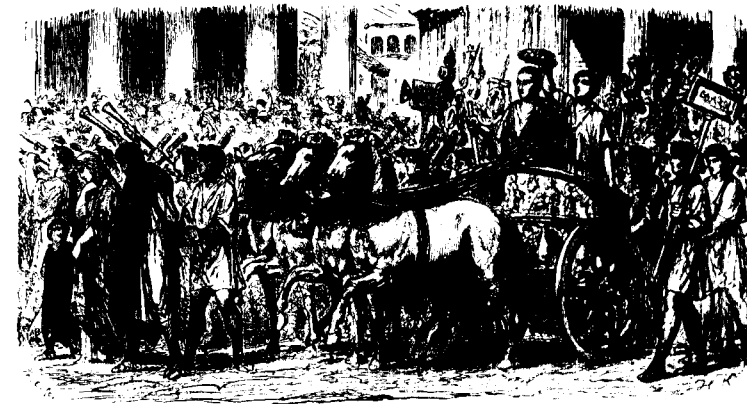
Un Triomphe romain.

Un volume grand in-8°, enrichi de nombreuses cartes et illustrations.