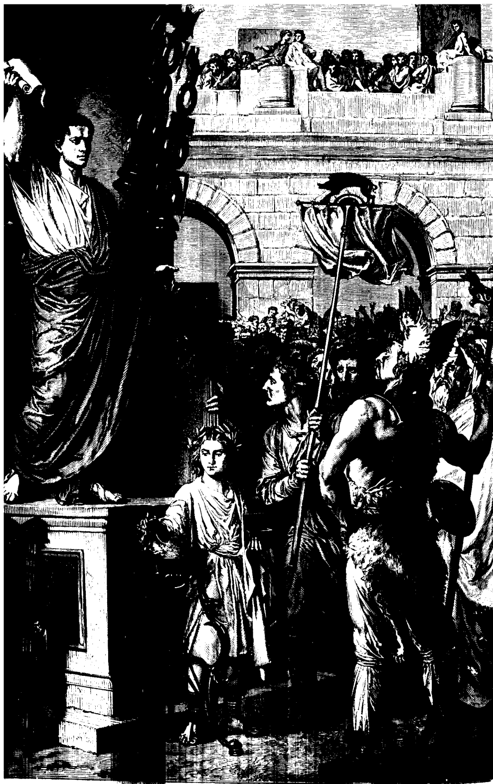
STE PRÉSENTE AUX DÉPUTÉS DES TROIS PROVINCES DE LA GAULE CELTIQUE, RÉUNIS À LYON. LA NOUVELLE CONSTITUTION. (TABLEAU DE SÉBASTIEN CORNU).