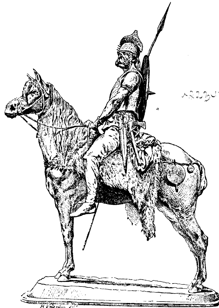
CHEF GAULOIS. (RECONSTITUTION PAR FRÉMIFT.)

Illustré de 500 Gravures et de 21 Cartes