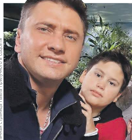
Личная страница Павла Прилучного в соцсети