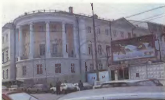
• Дом Юшкова на Мясницкой улице — детище Василия Баженова (96)