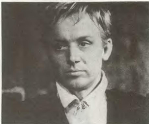
• Иннокентий Смоктуновский в роли Гамлета (112)

• На IV стр. обложки: Светильник из дворца датского короля Христиана VIII