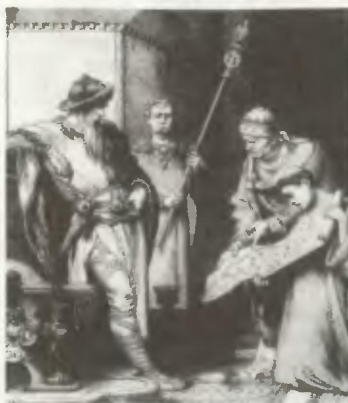
• Карл Великий рассматривает план Аахенской капеллы (123)