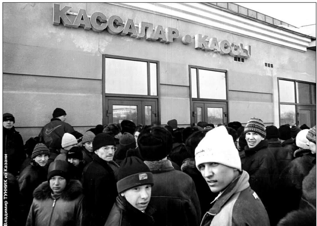
Вчера. Казань. За сутки до матча с «Магниткой»: болельщики штурмуют кассы Дворца спорта.

- Пока сюрпризов не было, но победы всем фаворитам даются непросто. Этим нынешний чемпионат и интересен.