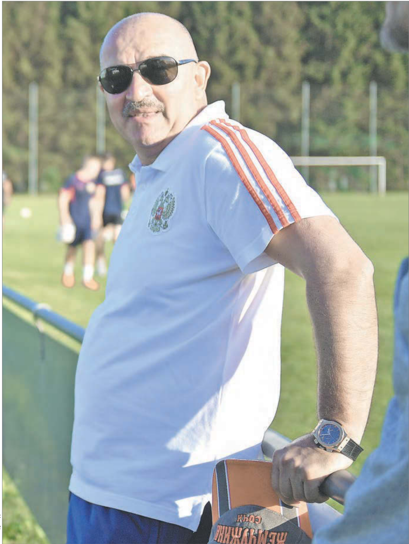
Июль. Главный тренер сборной России Станислав ЧЕРЧЕСОВ в Австрии.