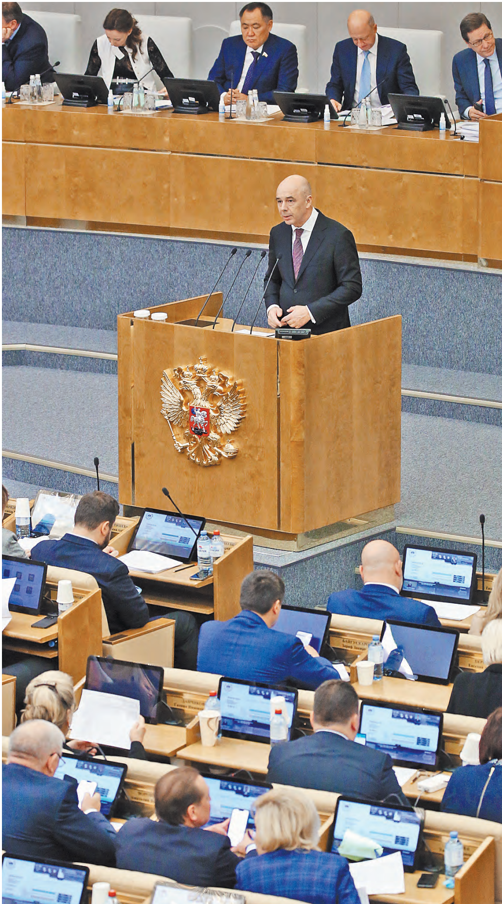
Глава минфина Антон Силуанов: В проекте бюджета проиндексированы все необходимые пособия.

ТЕНДЕНЦИИ Какую косметику и парфюмерию теперь покупают российские потребители