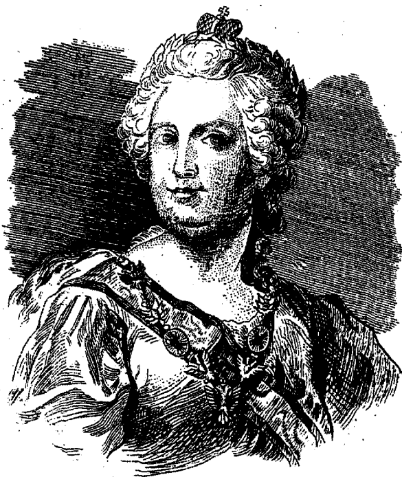
ИМПЕРАТРИЦА ЕКАТЕРИНА II.