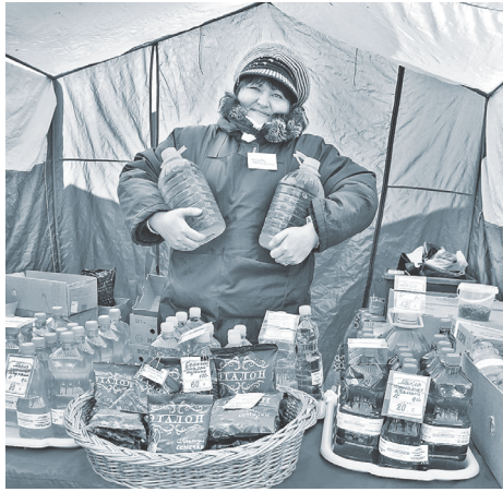
На свежем воздухе тор- говля идет быстрее.