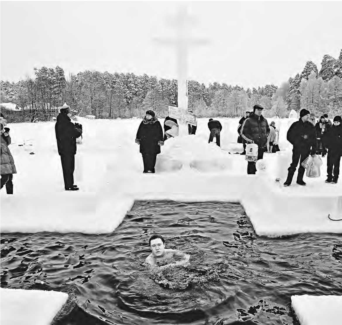
Православные татарстанцы готовятся к празднованию Крещения Господня. Погрузиться в иордань собираются около 60 тысяч человек. В республике подготовят более 110 купелей. В Казани их будет пять: возле храма в честь иконы Божией Матери «Животворящий источник» (ул. 5-я Кадышевская, 12), на озере Верхний Кабан со стороны улицы Борисковской, 54, около кафе «Сокол» рядом с Храмом Нерукотворного Образа Христа Спасителя и на Волге у Никольской церкви.