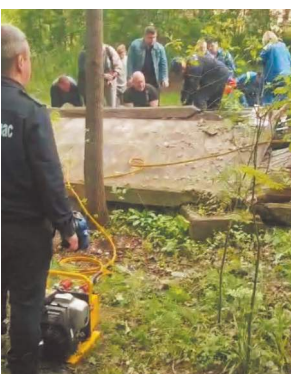
Площадка подмосковной Балашихи.

Как выяснил «МК», после занятий компания из пяти учащихся 5–6-х классов (все подростки из разных школ) отправилась на прогулку в лес. Позже дети рассказали, что в какой-то момент им стало скучно и они обратили внимание на заброшенную строительную площадку на улице Колдунова, огороженную бетонным забором. Подростки решили ради интереса перелезть через забор и посмотреть, что за ним. Одна из плит была наклонена и рухнула, когда два школьника уже перелезли через нее (двое суток спустя вес обоих двенадцатилетних мальчиков составил около 110 кг). Одному из ребят забор упал на грудную клетку, а также серьезно повредил