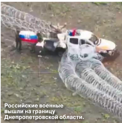
Российские военные вышли на границу Днепропетровской области.