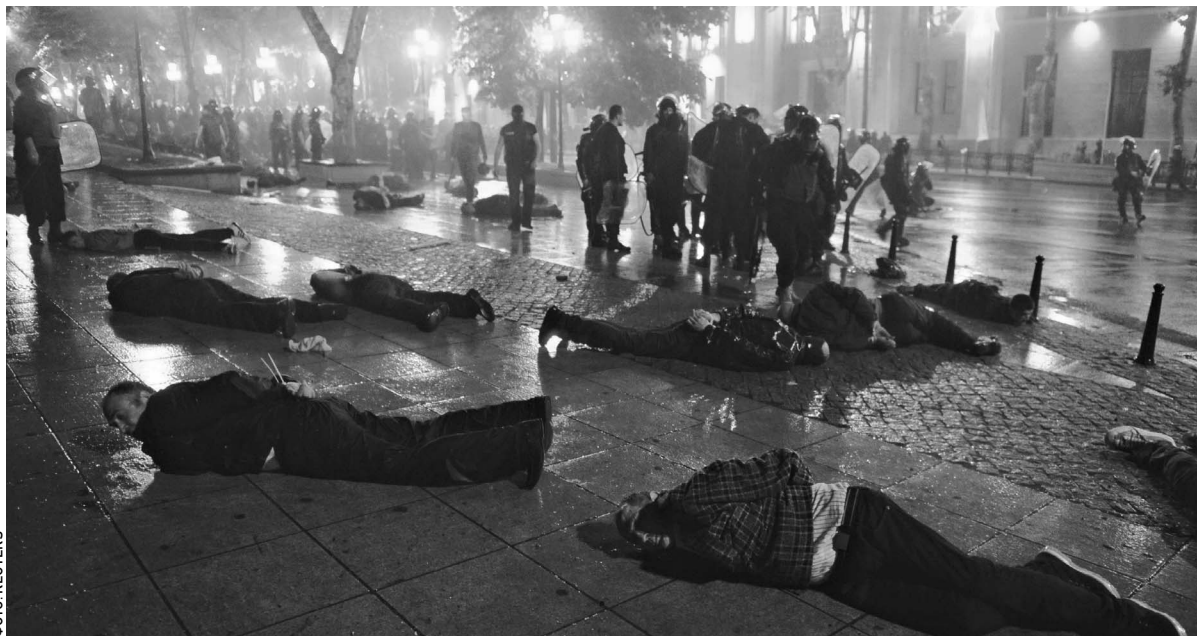
Демонстрантов в Тбилиси поливали из водяной пушки и били дубинками