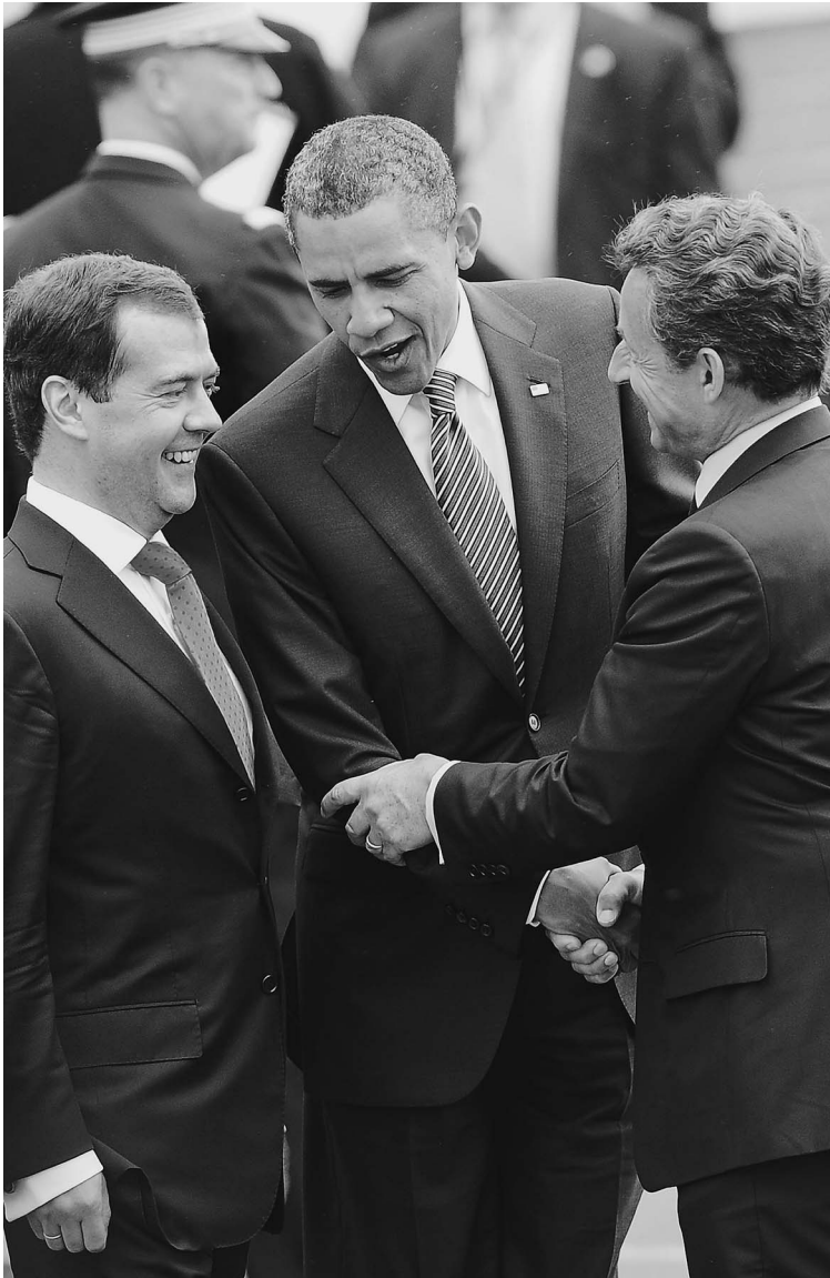
Николя Саркози приветствует Дмитрия Медведева и Барака Обаму

Участие Дмитрия Медведева в саммите «восьмерки» во французском Довиле началось с приятной ноты. Первая же двусторонняя встреча с президентом Франции Николя Саркози завершилась решением давнего вопроса о покупке вертолетоносцев «Мистраль». Контракт будет подписан через 15 дней. Его окончательная стоимость пока не сообщается. Скорее всего сумма сделки перевалит за 1 млрд евро →02