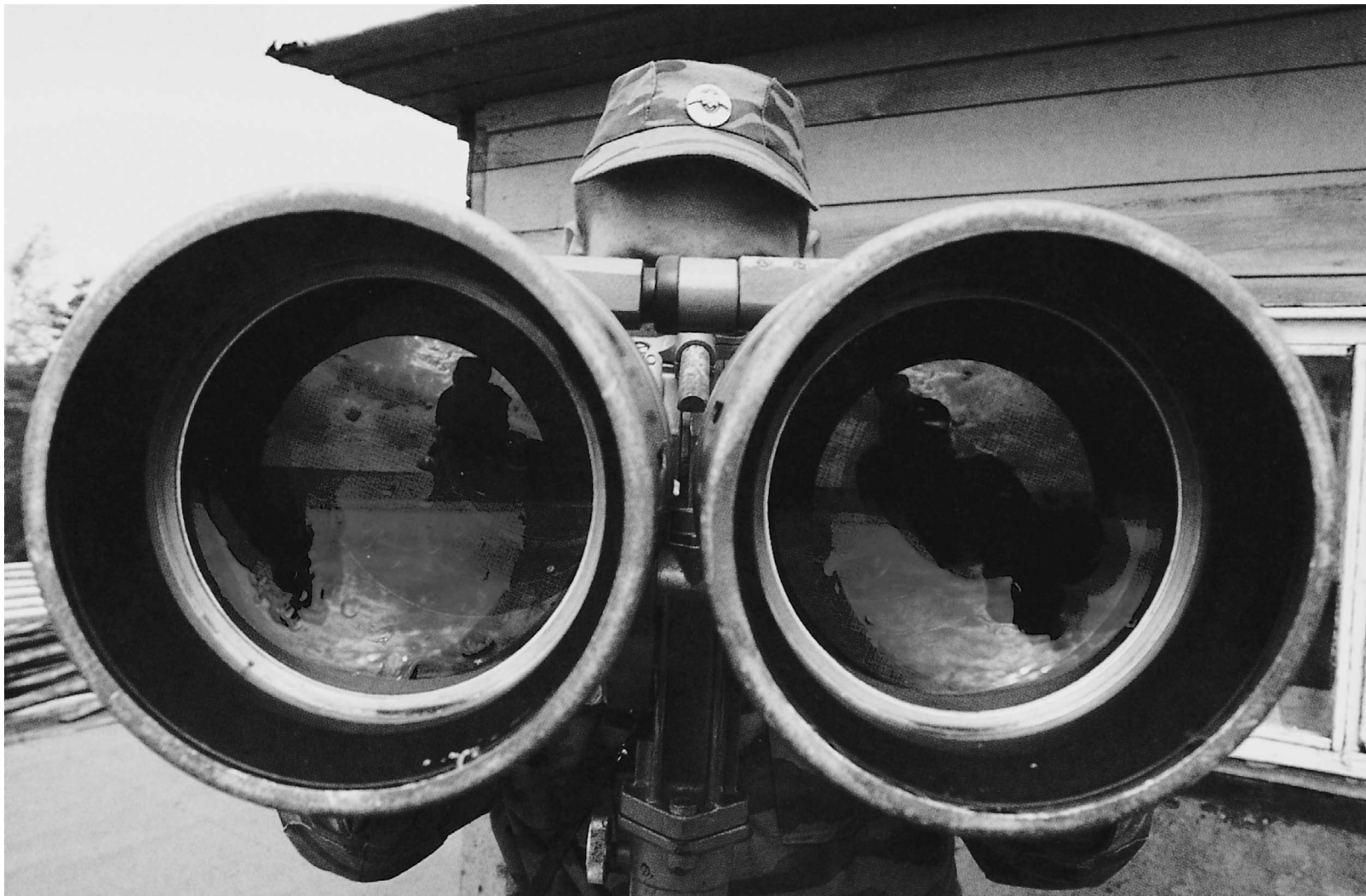
Число пограничников с 2003 года уменьшилось более чем на треть

Для охраны рубежей России требуются 29 сторожевых кораблей и сотни вездеходов мощностью в одну лошадиную силу