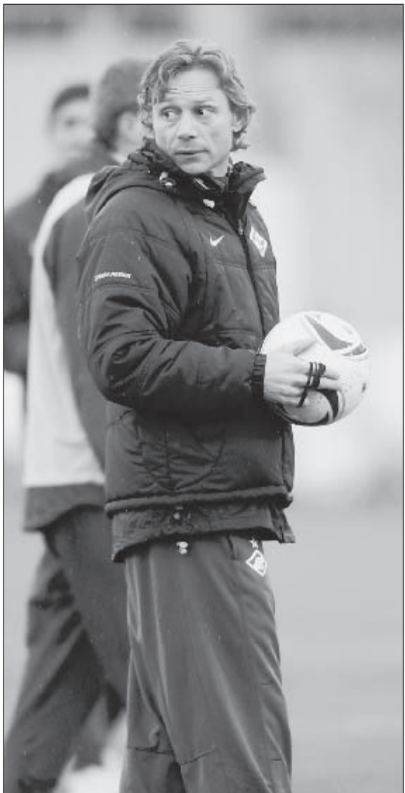
Вчера. Тарасовка. Тренировка «Спартак». Валерий КАРПИН.

«Не имеет он право делать такие заявления! Карпин работает не за себя - а за «Спартак» и болельщиков. Раз уж вправил - тащи. А если что-то не получается, нельзя тут же все бросать и уходить».