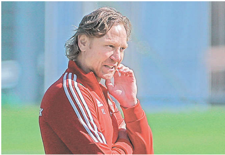
Главный тренер сборной России Валерий Карпин