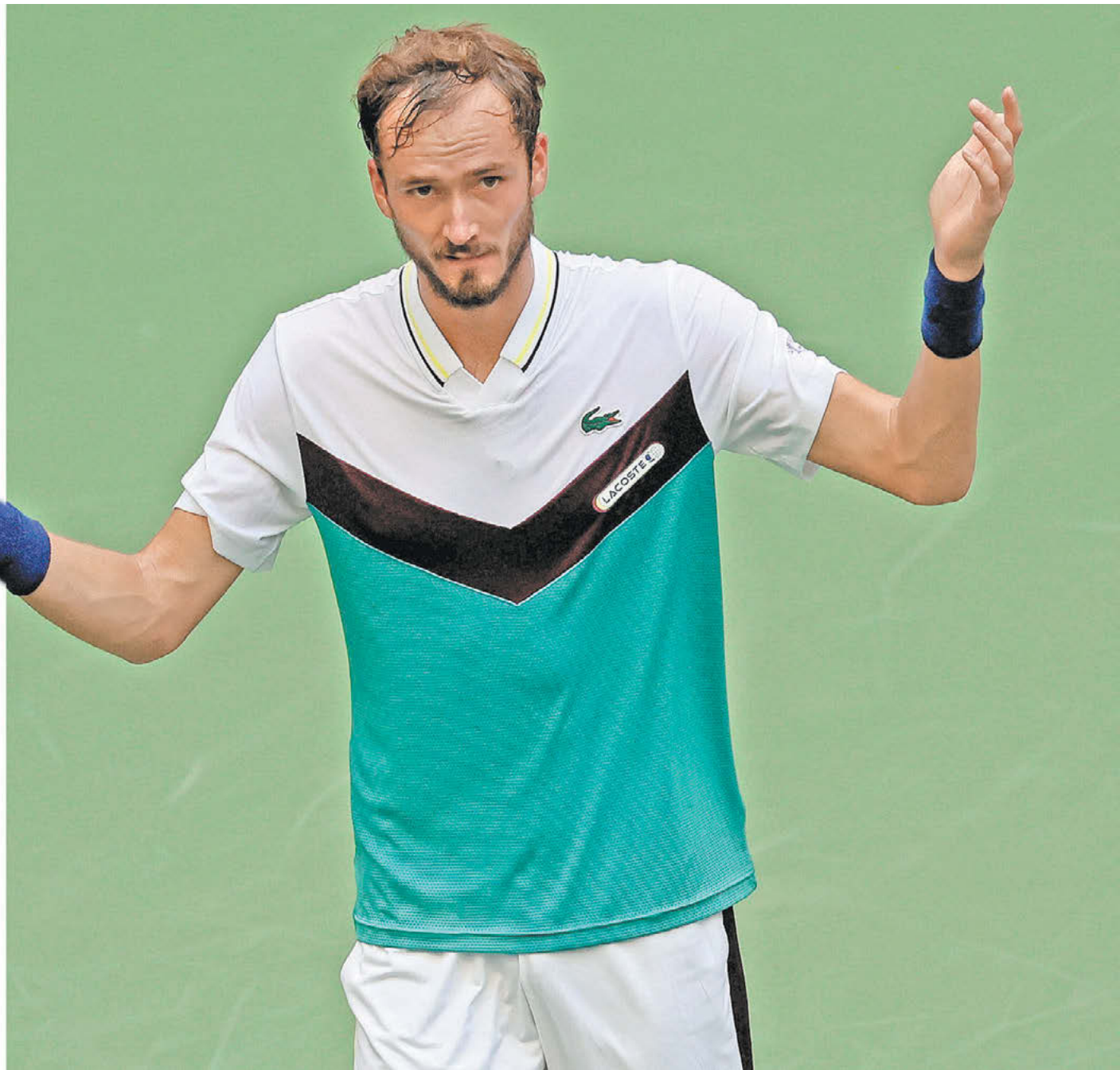
Вчера. Нью-Йорк. Даниил Медведев после победы над Андреем Рублевым