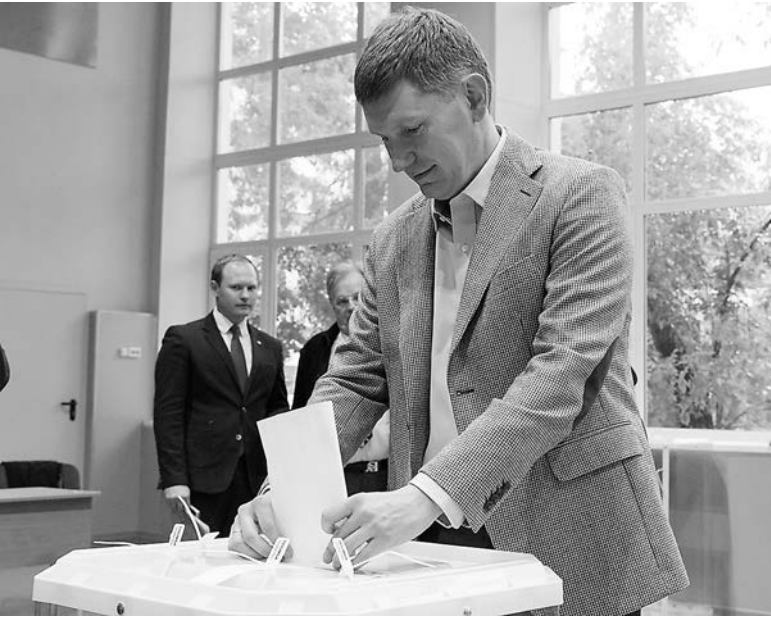
ПРЕСС-СЛУЖБА ГУБЕРНАТОРА ПЕРМСКОГО КРАЯ