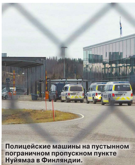
Полицейские машины на пустынном пограничном пропускном пункте Нуйямаа в Финляндии.