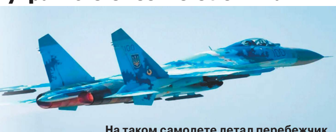
На таком самолете летал перебежчик.

В соцсетях появилась информация о переходе на нашу сторону украинского военного летчика