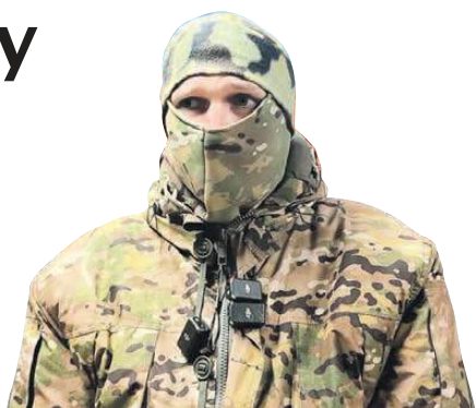
Александр КОЦА/«КП» - Москва