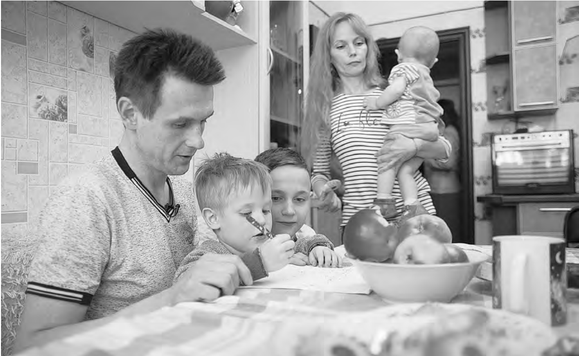
ПРАВИТЕЛЬСТВО ИВАНОВСКОЙ ОБЛАСТИ

В БРЯНСКОЙ области в рамках программы «Десятилетие детства» начал работу первый детский сад в Стародубе на 150 мест—«Солнышко». Открытия дошкольного учреждения много лет ждали дети, родители и педагоги. Строительство детского сада было начато еще в 2012 году, затем стройку приостановили. Позже в кратчайшие сроки здание достроили. Новый детский сад отвечает всем современным требованиям.