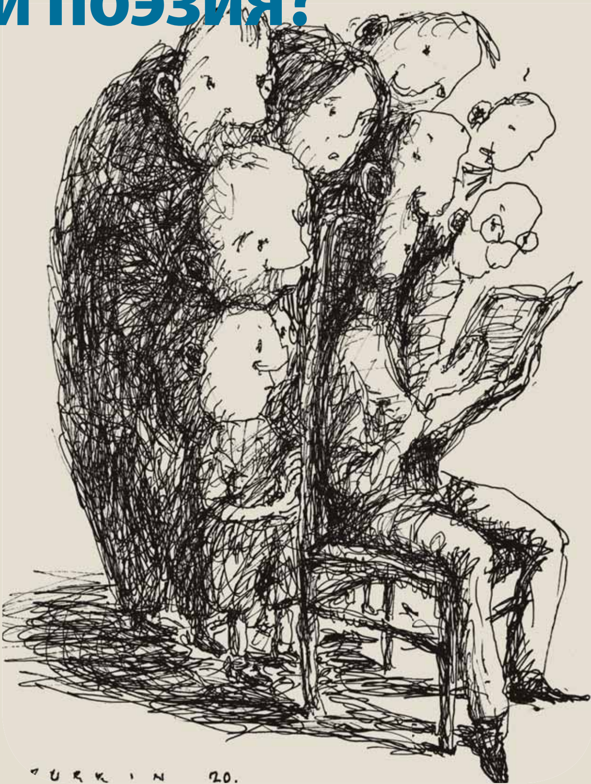
РИСУНОК: ВЛАДИМИР БУРКИН