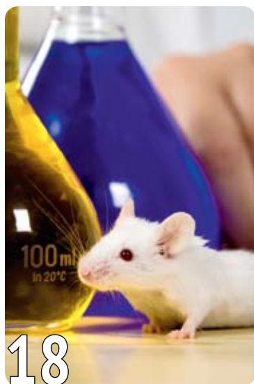
В помощь лабораторной мыши