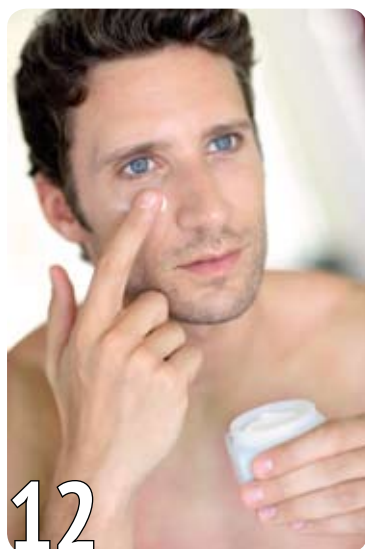
Для настоящих мужчин