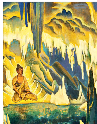
Nicholas Roerich. Buddha the Winner. 1925. Tempera on canvas, 742×1177 cm. International Center-Museum. N.K. Roerich, Moscow