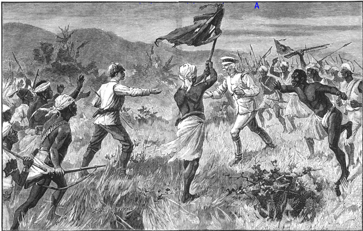
Wiedervereinigung mit Stanley.