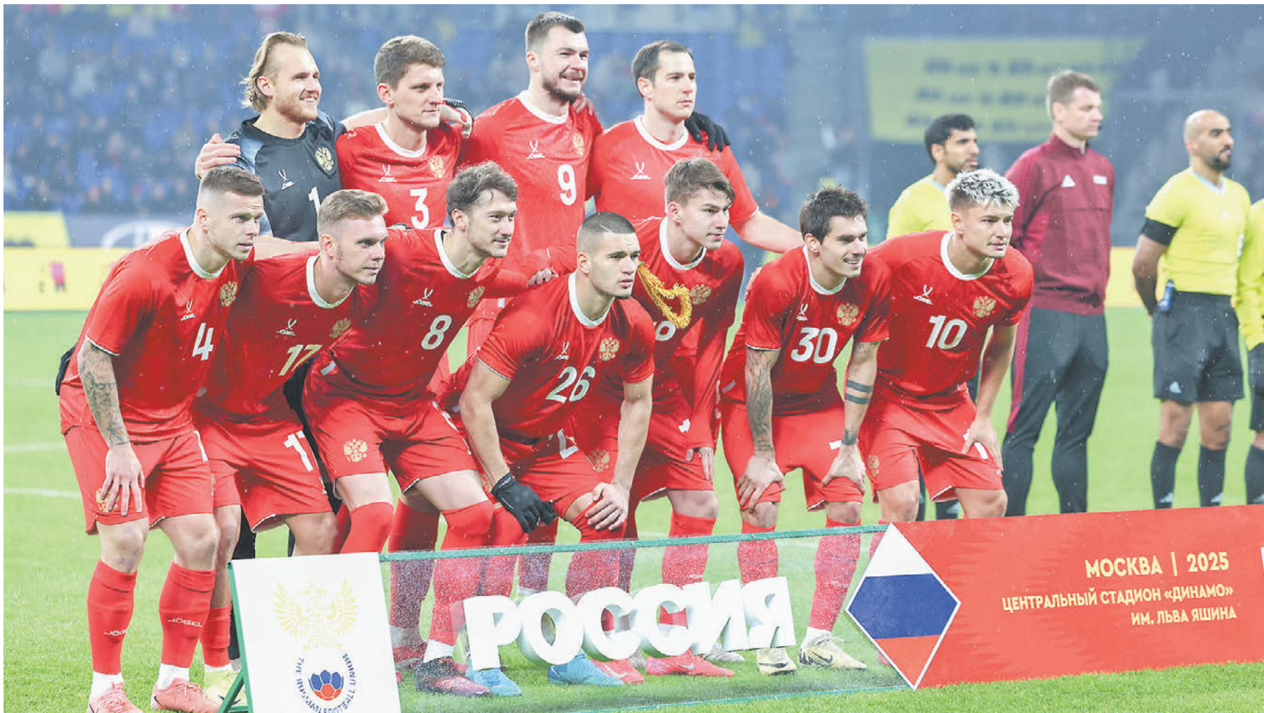
25 марта. Москва. Петровский парк. Россия – Замбия – 5:0. Игроки нашей команды перед началом домашнего матча

Разговор на актуальные темы с генеральным секретарем РФС